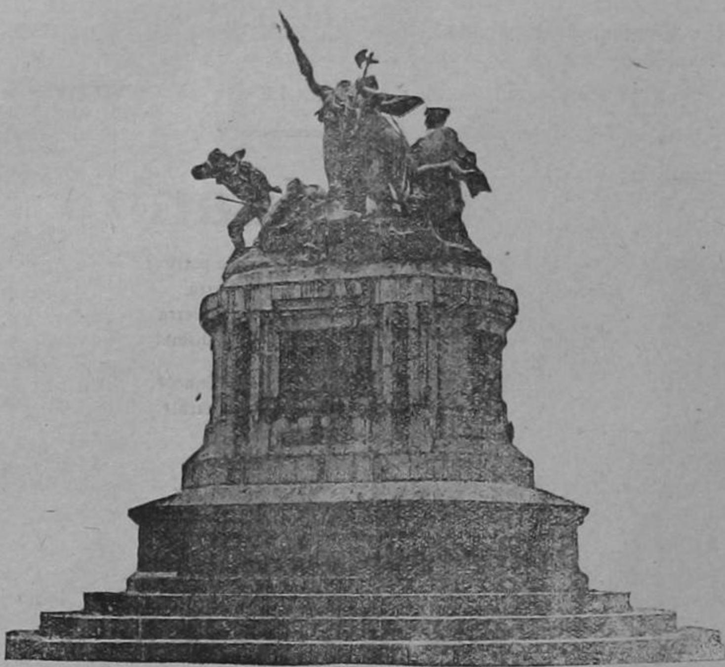
Monumento conmemorativo de nuestras glorias nacionales, inaugurado el 15 de setiembre de 1895.