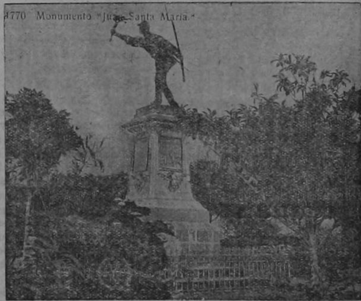
Estatua de Juan Santa María en la ciudad de Alajuela