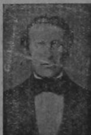
General don José Joaquín Mora, generalísimo de las fuerzas aliadas centroamericanas contra los filibusteros