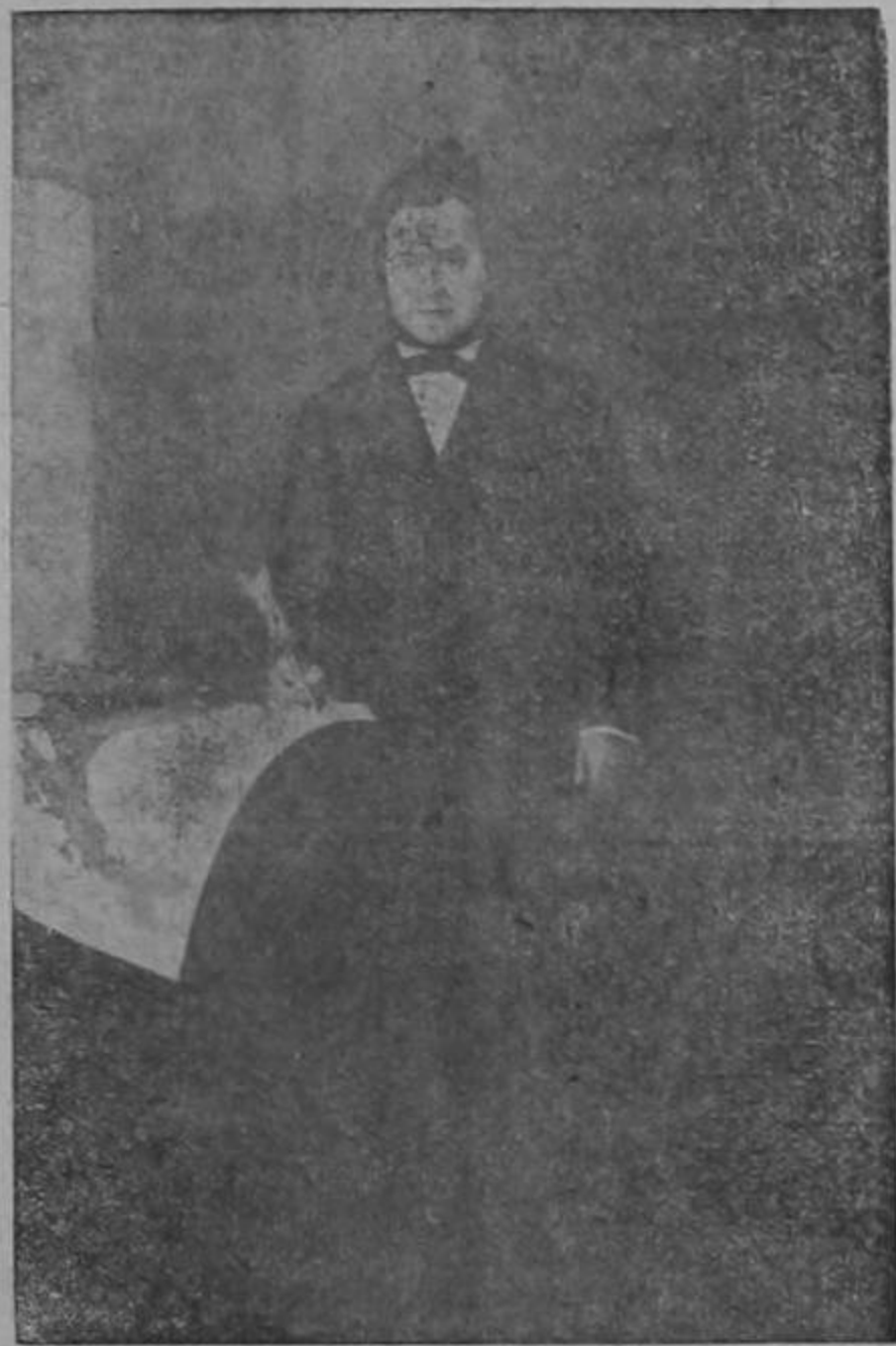
GENERAL DON JUAN RAFAEL MORA Prócer de la autonomía de Centro América