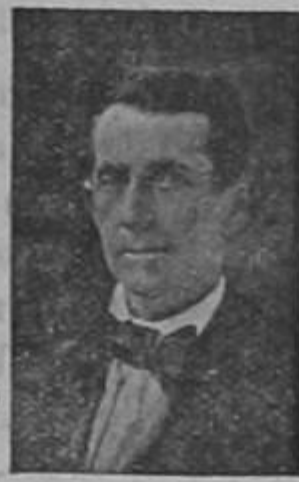
General don José María Cañas, Jefe de las fuerzas costarricenses expedicionarias