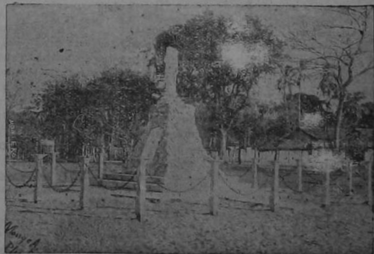
Monumento erigido en Puntarenas, en el propio sitio donde fueron pasados por las armas los generales don Juan Rafael Mora y don José María Cañas